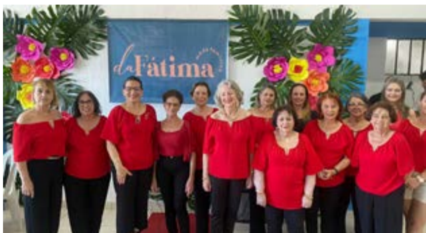
Desfile de moda da loja Fátima em evento da Casa da Amizade