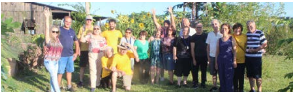
Guaíba Foto Clube em momento de confraternização de final de ano.