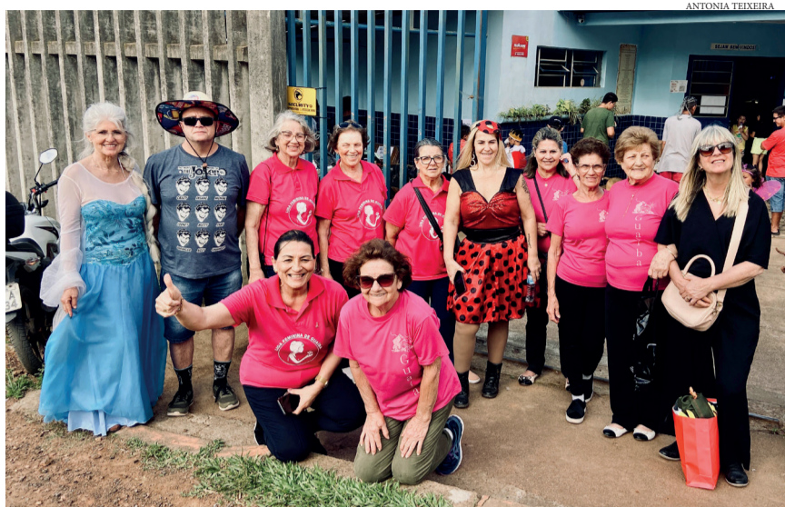
NO LOGRADOURO: Atividade da Liga Feminina e Casa da Amizade, na escola Santa Catarina, no bairro Logradouro, com atividades marcando o Dia da Criança.