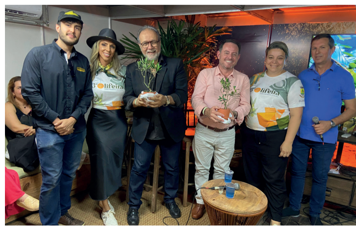
ENCONTROS: Lideranças políticas e empresariais no evento