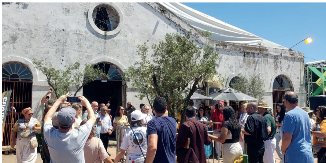
ATO ECUMÊNICO: Na Olifeira ocorreu um abraço simbólico a uma oliveira em frente ao antigo Mercado Público simbolizando a necessidade de união de todos e da importância de cada religião para superar todos os obstáculos após a enchente.