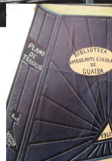
PELAS ESCOLAS: Biblioteca era opção de leitura em Guaíba