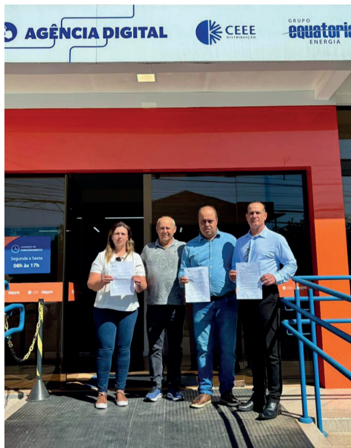
Equatorial Energia - CEEE, sobre os serviços realizados pela Equatorial na cidade de Guaíba.

Nesta semana, novamente o comércio do Centro teve prejuízos pela falta de energia.