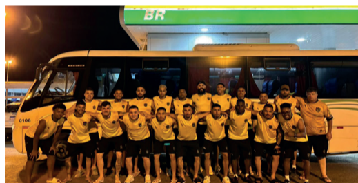
ESPORTE: A equipe do Penharol de Guaíba joga em Santa Catarina nesta sexta, 15 pelo Brasil Open de Futebol 7. Primeiro jogo será às 17h30min contra a equipe do Catarinense e às 23h10min contra a equipe da Chapecoense.

SAÚDE: A prefeitura de Guaíba irá construir a UNIDADE DE SAÚDE TAPÊ PORÃ, para realização de atendimento médico, de enfermagem e odontológico. O prédio contempla duas salas de atendimento, um hall, copa, sanitário PNE (Portador de Necessidades Especiais) e DML (Depósito de material de Limpeza), e foi planejado para atender outra sala, numa possível ampliação. Localizada na Comunidade Indígena Tapê Porã (Estrada do Cemitério Passo Grande) no Município de Guaíba/RS.