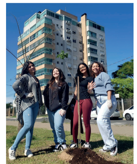
ENGENHO: Plantio de árvores em áreas destruídas pela enchente. Prefeito realiza o plantio da milésima árvore, um ipê.

biental que beneficiará Guaíba e a região”, destacou o prefeito.