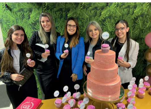
. IGREJA ASSEMBLEIA DE DEUS: Escola de Betânia comemorou dois anos .Parabéns.