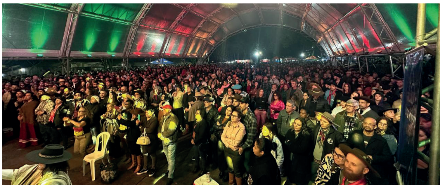
FIM DE SEMANA: Sarandeio no CTG Gomes Jardim segue nesta sexta, e sábado.