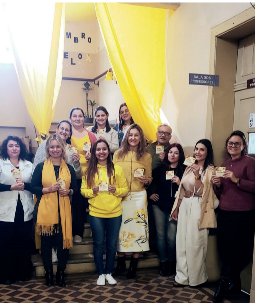
SETEMBRO AMARELO: Setembro Amarelo tem mobilizado também as escolas. Fotos de ações na Escola Gomes Jardim que conta com equipe de estagiários de psicologia e psicóloga e na Escola Frederico Link, professores e alunos saíram às ruas para divulgar o Setembro Amarelo.