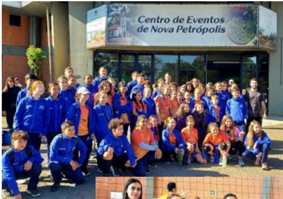
Guaíba na 8ª edição do Dia Estadual do Voleibol o Dia Estadual do Vôlei,

O evento foi organizado pelo Projeto Vôlei Nova Petrópolis, em parceria com a Prefeitura Municipal de Nova Petrópolis e a Federação Gaúcha de Voleibol, contando com o apoio da Confederação Brasileira de Voleibol e o Sesc Senac.