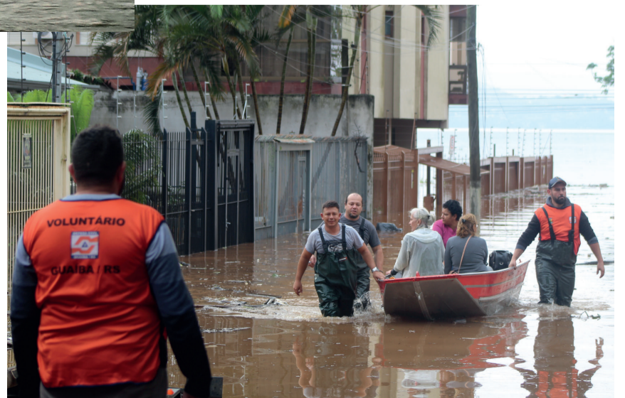
Milhares de famílias tiveram que deixar as casas. Imagens do Centro e Florida