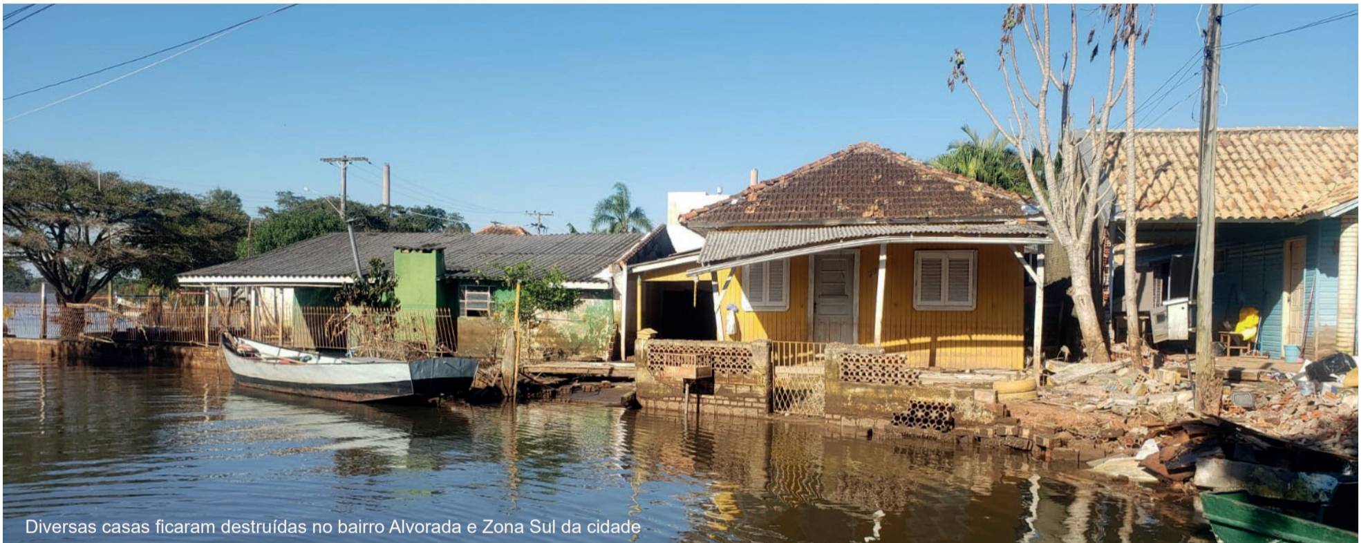
Diversas casas ficaram destruídas no bairro Alvorada e Zona Sul da cidade

Redução das águas de maio mostra destruição de diversas casas nos bairros Alvorada, Florida e IPE. Semana de limpeza e reconstrução. Equipes da Prefeitura Municipal, Marinha do Brasil e empresas privadas estão trabalhando em cinco bairros simultaneamente para remover os entulhos causados pelas enchentes,