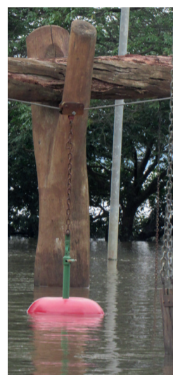
Corde chegou a ser amarrada na estátua de José Cláudio Machado, brincando da maçã ficou praticamente debaixo da água e a marca da solidariedade com marmitas para os abrigados.