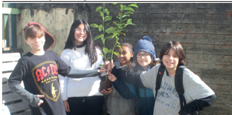
RECOMEÇO: O retorno das aulas no Instituto Gomes Jardim, o acolhimento dos alunos depois de um mês sem aulas, foi marcado com atividades lúdicas, exibição de filmes gaúchos, oficinas. Nesta semana, foi plantada na futura praça dos Livros Walter Galvani, uma muda de erva-mate, a árvore símbolo do RS.