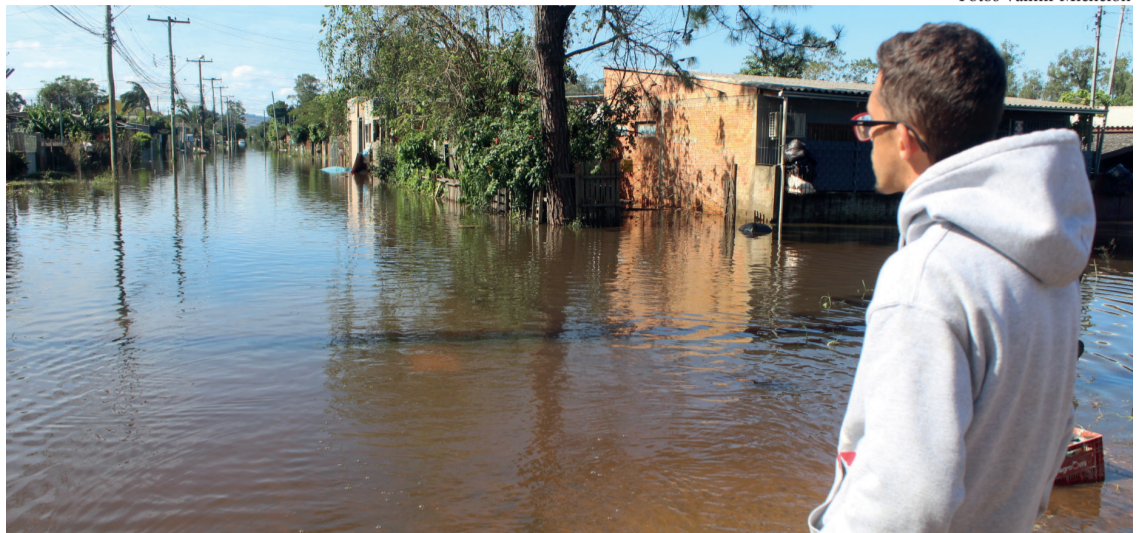
Jonatas Israel Almeida Silva, 33 anos, olha apreensivo para sua casa debaixo da água no IPE.

Mora na rua 3 no loteamento do IPE e sua casa nunca tinha sido atingida pela água.