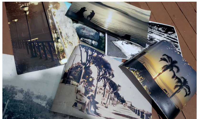
Muitas memórias perdidas com a enchente. Algumas fotos em exposição no bar Bêra se salvaram.