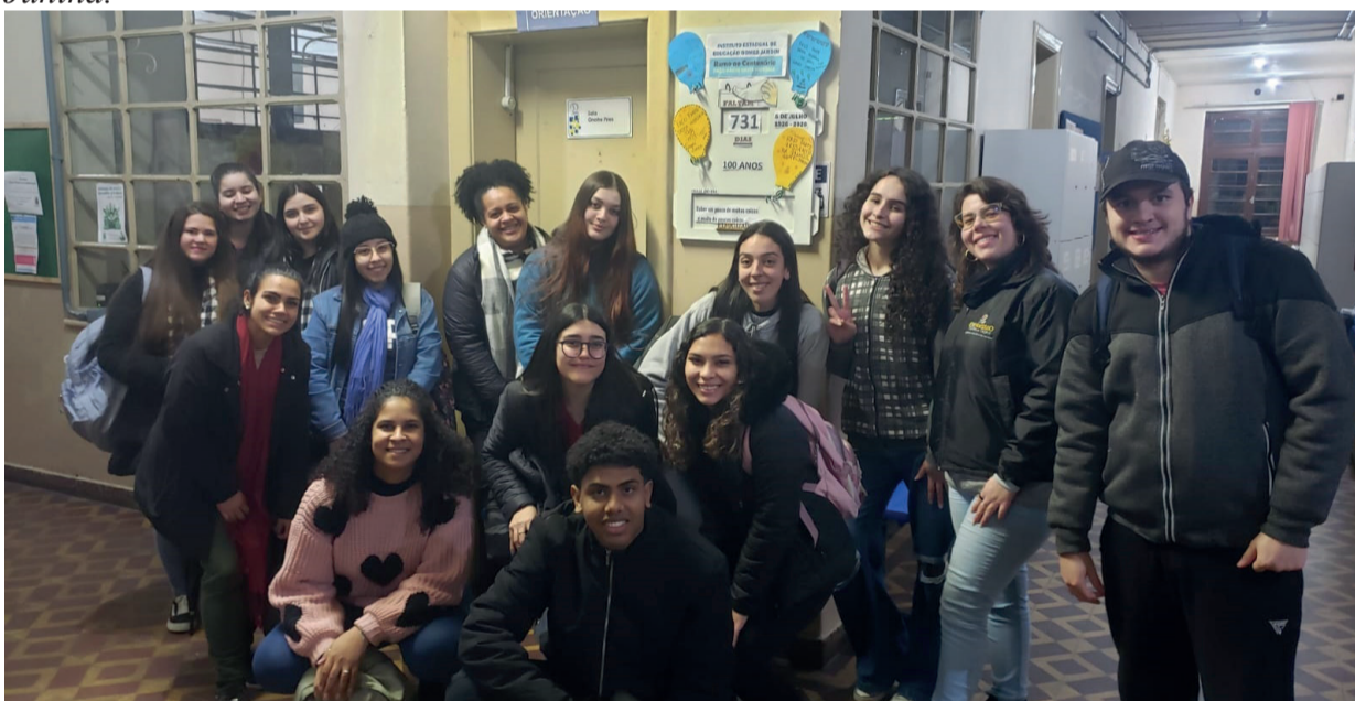
CONTAGEM: Alunos cantaram os parabéns e inauguraram painel com contagem regressiva dos 100 anos.

Na segunda, 8 de julho, a Associação Canto Coral de Guaíba fez apresentação na escola, dentro das comemorações do aniversário. No dia 20 de julho, acontece a tradicional Festa Junina.