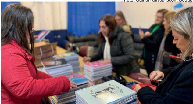
Equipe diretiva preparou kits de boas-vindas