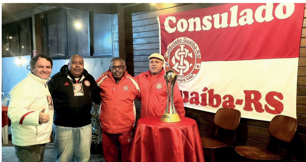
Guaíba sediou na terça, 30, reunião dos Consulados do Inter da Região no Viking Bar