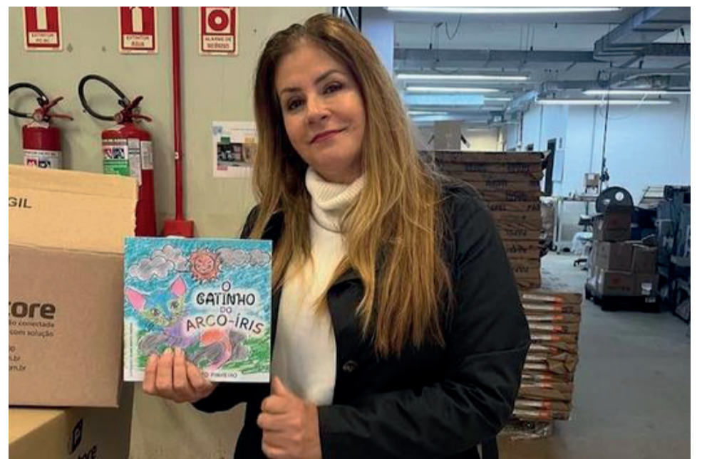
A autora no momento em que recebia os exemplares da obra