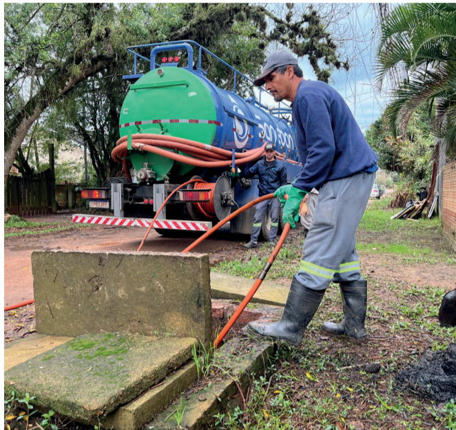
NAS RUAS: Prefeitura busca desobstruir bocas de lobo

E, como medida de prevenção para a instabilidade climática, a Prefeitura de Guaíba destinou dois caminhões de hidrojato para as atividades de desobstrução das bocas de lobo a fim de melhorar o escoamento de água dos bairros. Os hidrojatos estão em operação desde o início da semana e, a previsão para a próxima, é contratar mais quatro caminhões para somar à equipe de prevenção aos danos causados pelas chuvas. A operação acontece nos bairros Cohab, Santa Rita, Ipê, Engenho, Centro, Alvorada, Alegria e Florida.