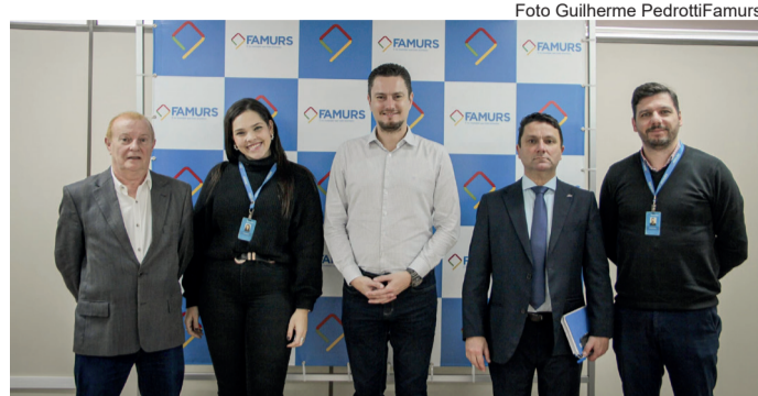
PÓS-ENCHENTE: Entidades buscam soluções