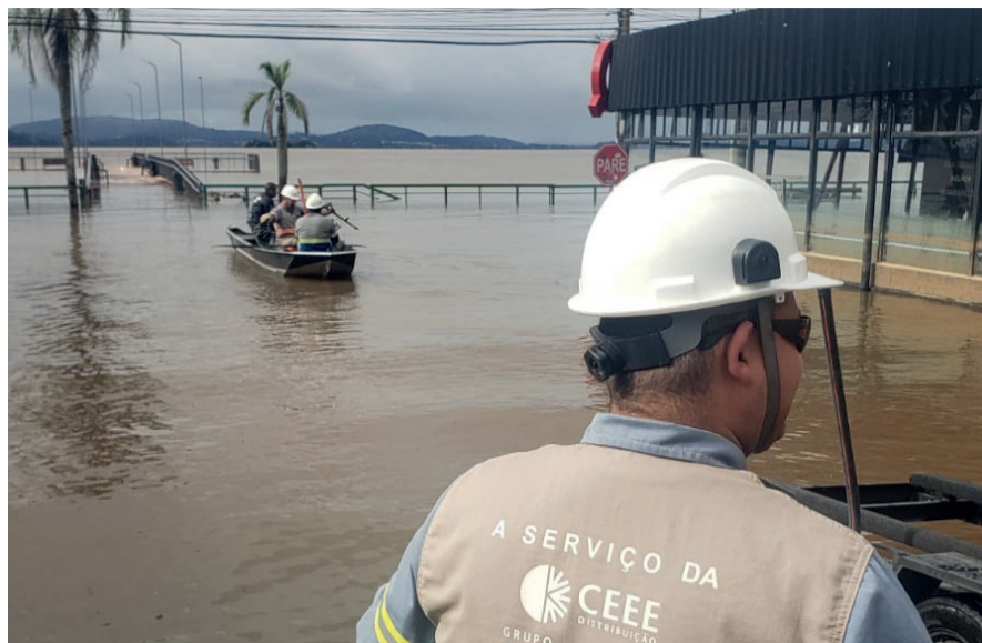
A CEEE Equatorial trabalhou na semana para ligar energia em alguns pontos da orla do Guaíba. Famílias ficaram mais de 20 dias sem energia por causa dos riscos em virtude da enchente.