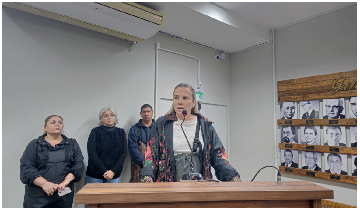
NA CÂMARA: Moradores lotaram audiência pública