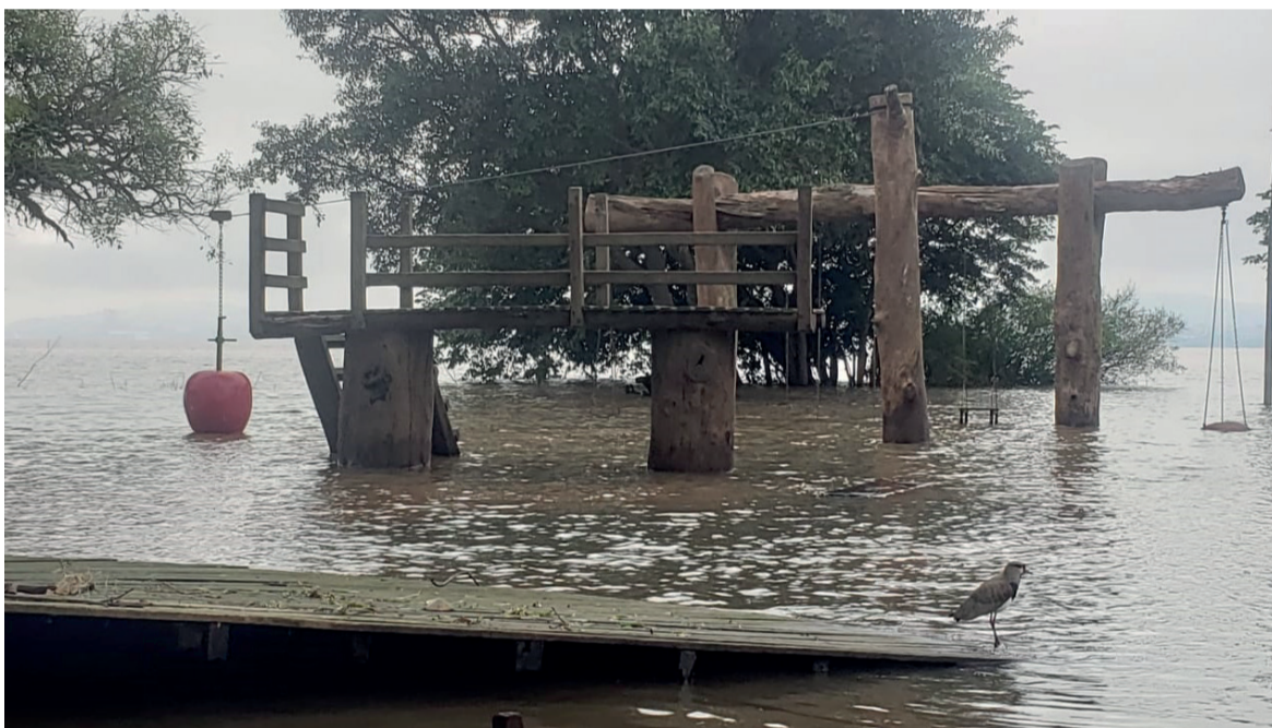
ESPERANÇA: Amanhecer depois de dias nublados e chuvosos. Aos poucos água recua no parque Natural.