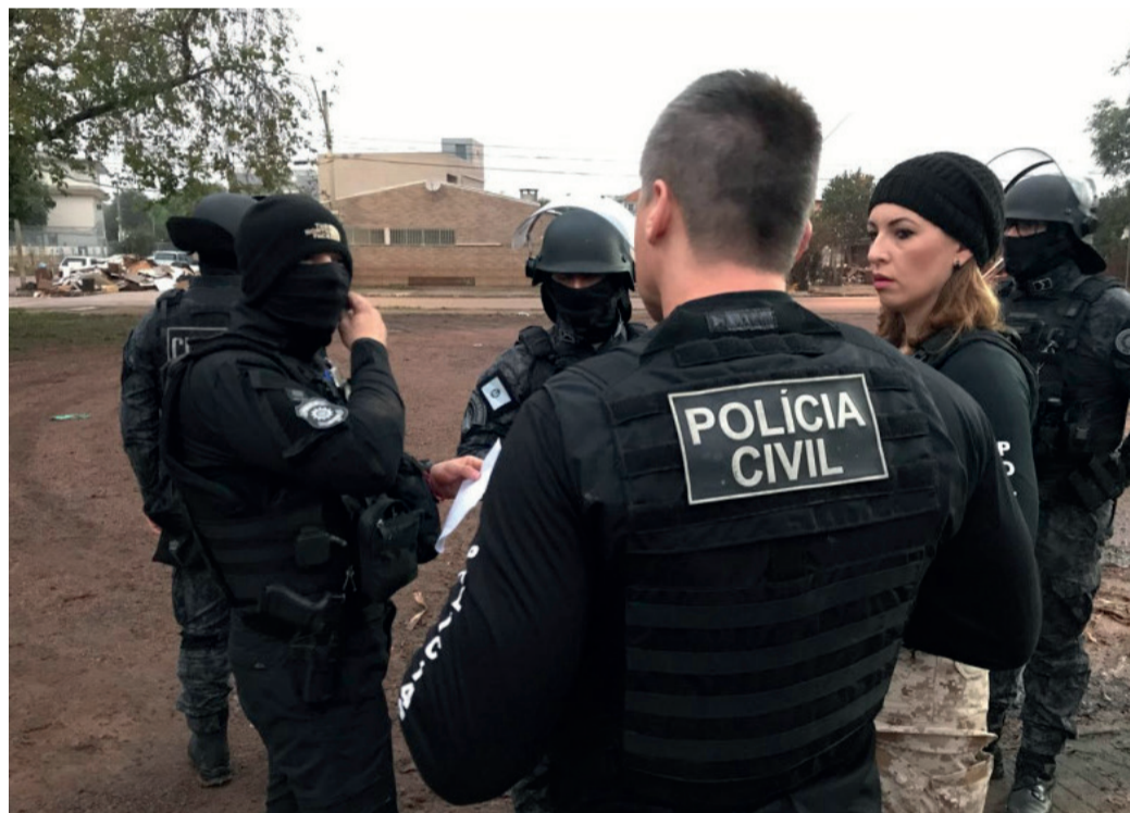
ELDORADO: Foram cumpridas 33 ordens judiciais, entre 25 mandados de busca e apreensão e oito mandados de prisão preventiva, em ação repressiva contra os crimes patrimoniais que vinham ocorrendo em Eldorado do Sul, em decorrência das enchentes

PROTESTO: Nesta semana, moradores da cidade de Eldorado do Sul fizeram uma manifestação em frente ao prédio da Prefeitura Municipal, para reivindicar a retirada dos entulhos que permanecem nas ruas.