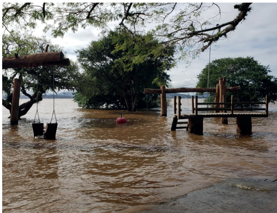
ALAGADO: Na manhã de quinta, 30, parque Natural coberto ainda de água e letreiro 'Amo Guaíba' é engolido pela água pela segunda vez em menos de um ano.