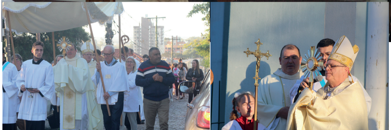
MATRIZ: Padres do Vicariato participaram da celebração com o bispo